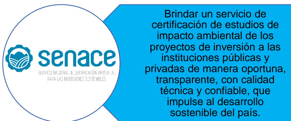
Gráfico N° 1: Misión del Senace

La Misión del Senace comprende tres elementos: el rol central, la población y los atributos, los cuales están orientados a establecer una declaración de su razón de ser en el marco de las políticas y planes nacionales, y que orienten el logro de los Objetivos Estratégicos Institucionales, según se detalla a continuación: