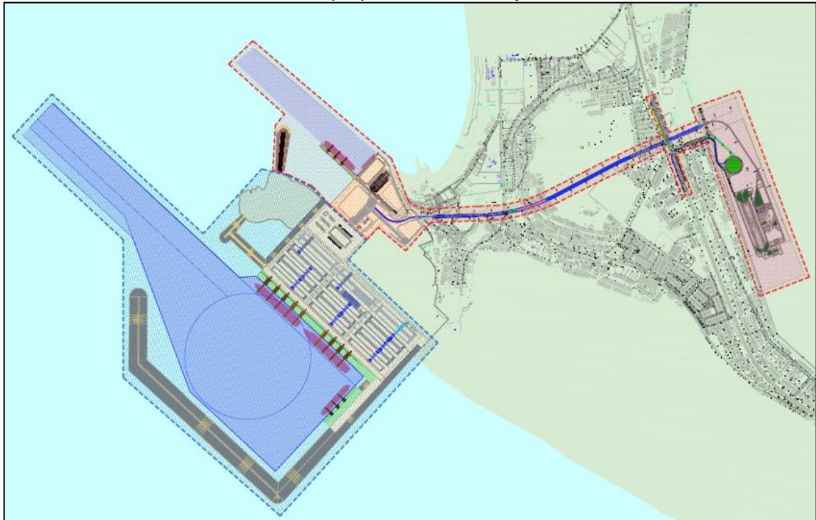
Figura 1: Layout general de la ampliación de la Etapa 1 del Terminal Portuario Multipropósito de Chancay

*Línea punteada de color rojo cuenta con EIA e ITS aprobado